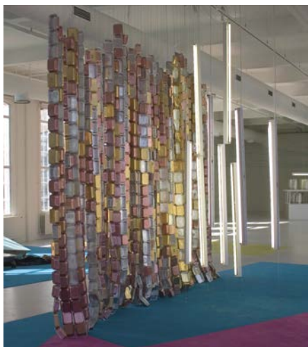
Jessica Stockholder : Bright Longing and Soggy Up The Hill , détail (2005), avec l'aimable autorisation de l'artiste et de Mitchell Innes & Nash, NY

De plus en plus d'artistes contemporains utilisent des articles du quotidien et des produits industriels pour montrer comment l'art peut être interprété sous différents aspects. Les objets fabriqués en feuille d'aluminium se révèlent être un support idéal.