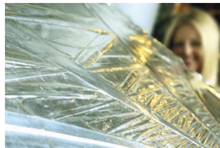
Œuvre de Stephan Grebe exposée à interpack