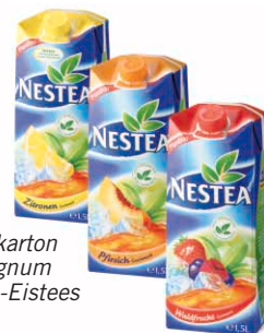
Der Aseptikkarton CombifitMagnum für NESTEA-Eistees

Coca-Cola in Berlin, war dies einer der Hauptgründe für den Wechsel von PET-Flaschen zu combifitMagnum: „Dieser große, ins Auge springende Karton von SIG Combibloc hebt uns klar vom Wettbewerb ab“.